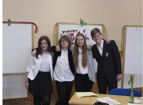
Tarján, 2018. március 25.

Tarjáni Német Nemzetiségi Általános Iskola Cím: 2831 Tarján Rákóczi út 13. Telefon: +36 (34) 372-634 E-mail: gs2000@axelero.net